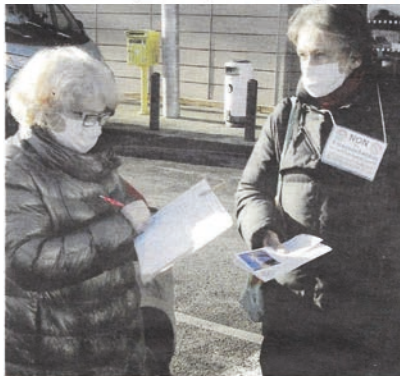
Les membres de l'association se rendent sur le terrain pour faire signer leur pétition.

Les membres de l'association, qui lutte contre le projet éolien, ont lancé une pétition. Aujourd'hui, près de 410 signatures ont été récoltées.